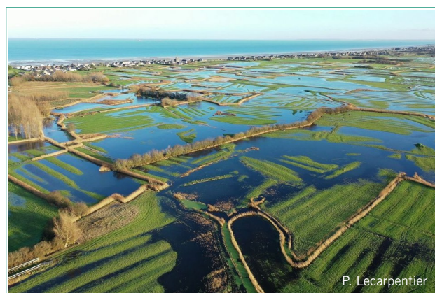
Les marais arrières littoraux du secteur d'Utah-Beach en hiver.

Ces marais sont formés par les vallées de quatre fleuves : l'Aure, la Vire, la Taute et la Douve qui se jettent en baie des Veys. L'Ay quand à elle débouche dans le havre de St-Germain-sur-Ay, sur la côte ouest du Cotentin. Des vallées auxquelles s'ajoutent les marais arrières littoraux de la côte Est du Cotentin bordant la célèbre plage d'Utah-Beach.