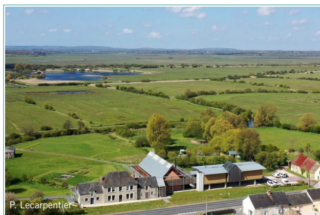
La Maison du Parc en été, est le point de départ pour découvrir les marais verts.

D'une part, la Maison du Parc vous propose de (re)découvrir un jardin pédagogique, des sentiers d'interprétation avec des observatoires et une boutique proposant des produits locaux et des jeux écologiques pour toute la famille.