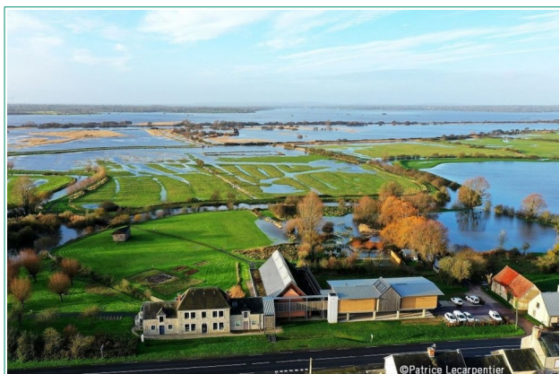
La Maison du Parc : un point de départ pour découvrir les marais blancs.

De janvier à mars, une belle saison s'offre à tous pour découvrir ces marais du Cotentin et du Bessin.